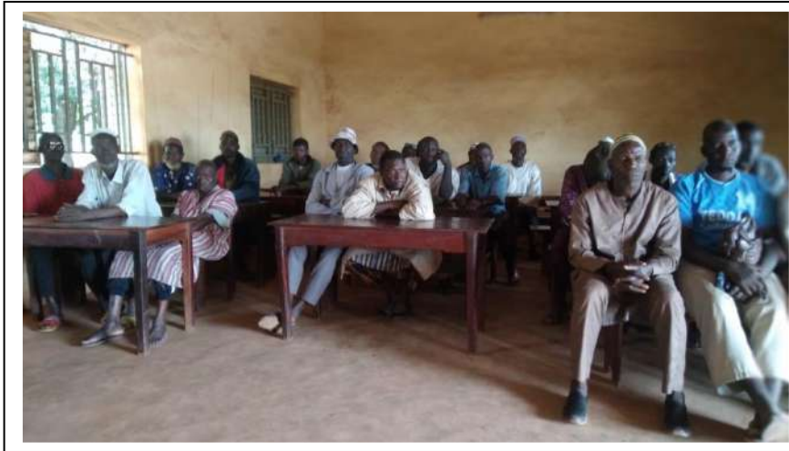
Les producteurs de maïs bénéficiaires en concertation

Dans la même période, trois cadres de concertation ont été organisés dans les différentes préfectures cibles du projet entre les différents acteurs autour de la filière. L'objectif était de définir à chacun le rôle qui lui revient pour la bonne marche du processus.