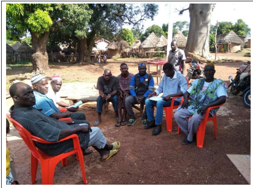
Réunion de sensibilisation des bénéficiaires du PIM à Mandiana

Courant la période trois (3) missions de sensibilisation ont été réalisées dans les différentes préfectures à l'intention des producteurs bénéficiaires du PIM pour une meilleure appropriation de l'initiative PIM. Les radios de la place et des rencontres sous l'arbre à palabre ont facilitées la bonne marche et compréhension des uns et des autres.