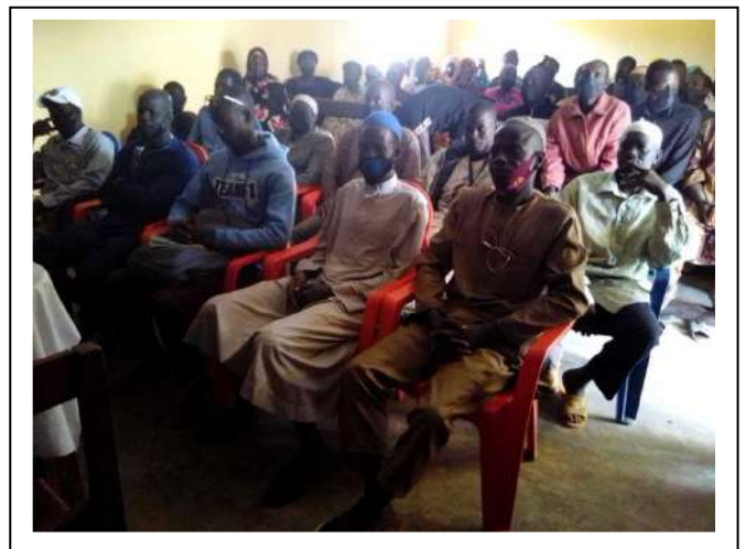
Les participants dans la salle de formation

L'objectif était d'initier tous les acteurs à :