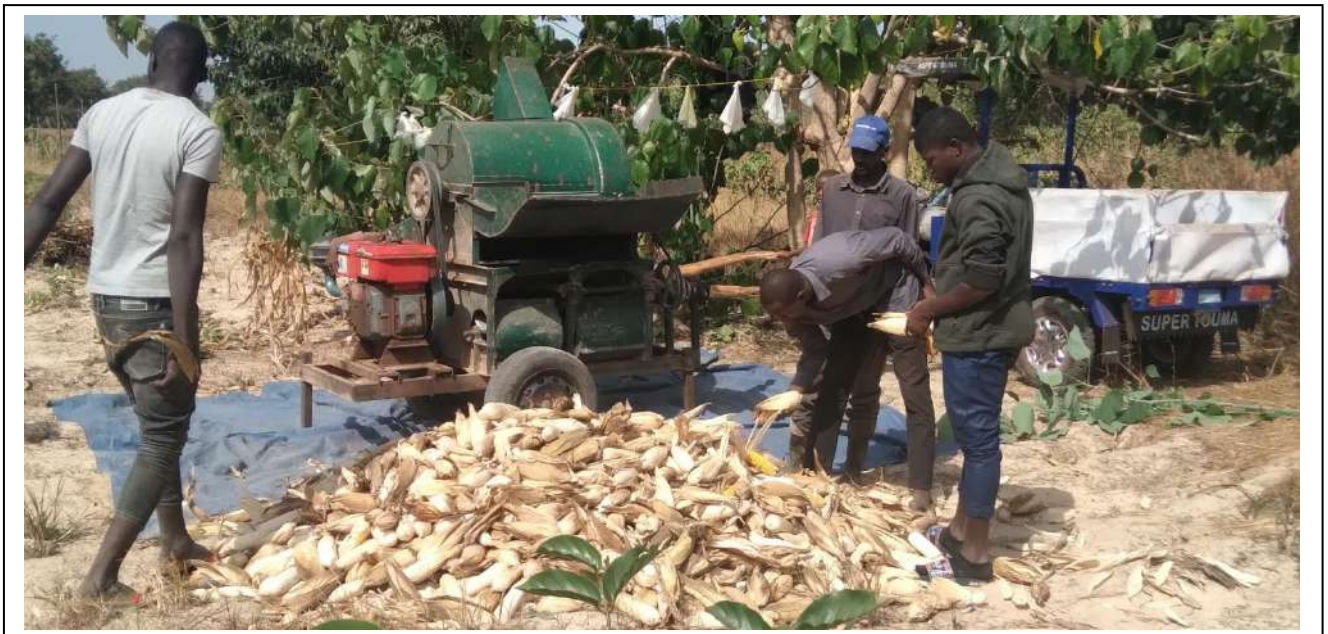
L'étape d'égrenage de maïs dans le champ d'un bénéficiaire

La FUPROMA avec son réseau de partenariat avec des tiers a procédé à la location des égreneuses pour faciliter l'égrenage des champs de maïs dans les différentes préfectures au bénéfice des producteurs. Elle a aussi facilité le transport des sacs de maïs des champs vers les points de regroupement.