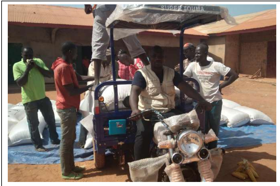
Transport des sacs de maïs vers les magasins de stockage

Des sessions de formation ont été réalisées dans les préfectures de Siguiri, Mandiana, Dinguiraye et Labé au bénéfice des différents acteurs de mise en œuvre du PIM.