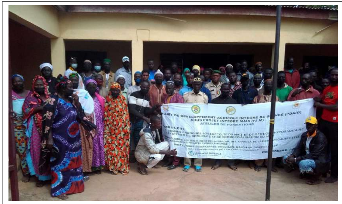
Photo de famille après les sessions de formation